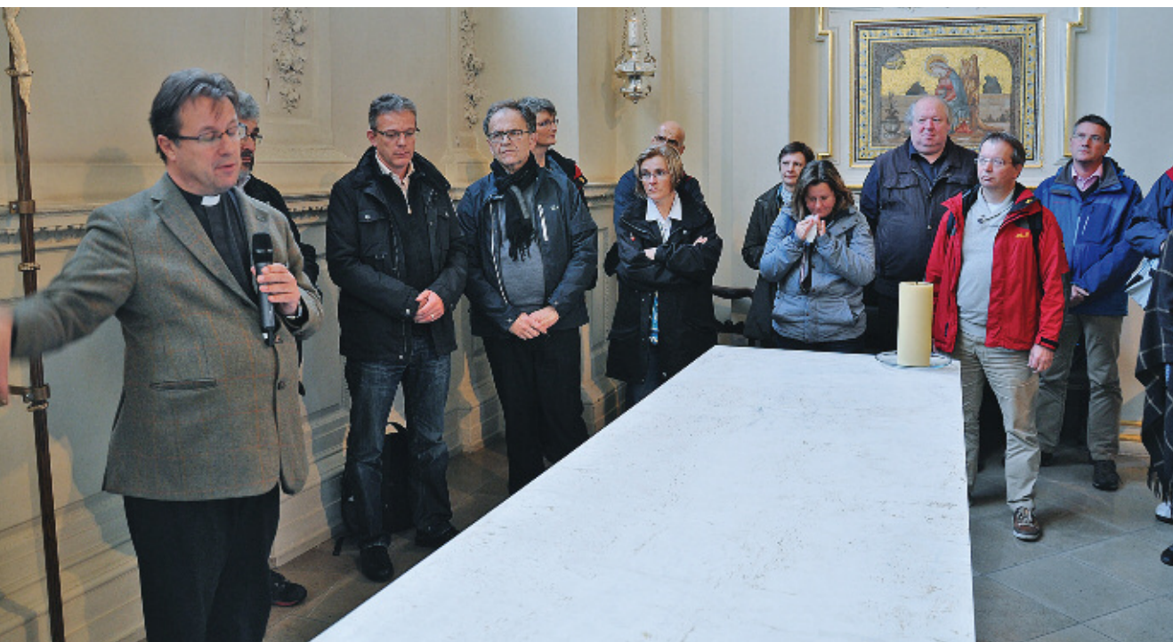
Ökumenisches Pfarrkolleg in London – Begegnung mit der anglikanischen Gemeinde St Martin in the fields

Die lange und lebendige ökumenische Tradition sowie die Vielfalt und Intensität des ökumenischen Miteinanders der Evangelischen